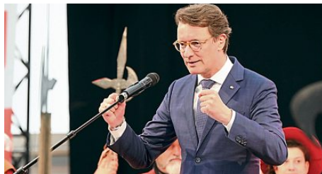
Den Kampf gegen Extremismus und Einsamkeit beschwor NRW-Ministerpräsident Hendrik Wüst in seinem Grußwort beim Empfang der Neustädter.

„starb“, warb er für die stärkere Einbindung bislang Außenstehender in die Ehrenämter.